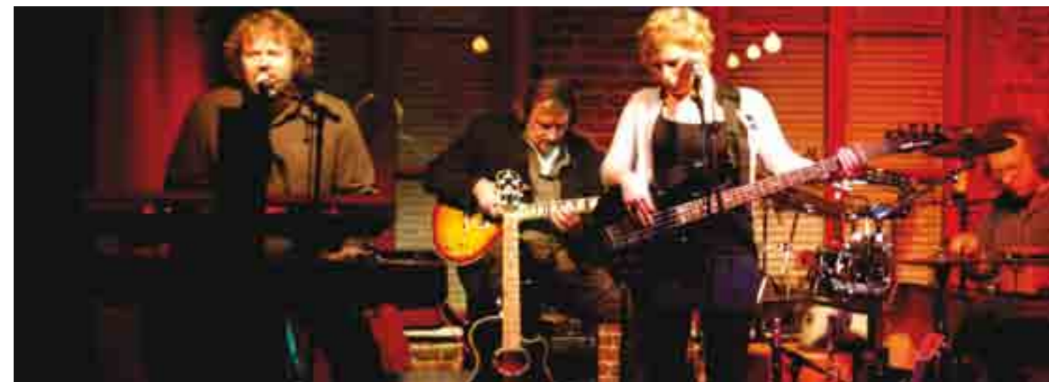
LE VÉLO VERT