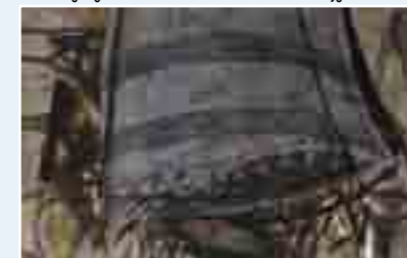
Enk De Kramer (Berchem ° 1946), zonder titel, ets, droge naald en carborundum

Toegang 4 EUR, 3EUR met korting; gratis met museumkaart (incl.toegang cultuurhistorisch museum SteM Zwiigershoek)